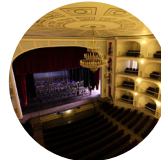
Teatro Principal Puebla